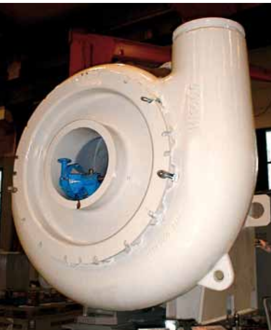
XM 600 mit MM25 in der Mitte